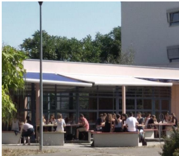
Création d'une terrasse au Restaurant Universitaire