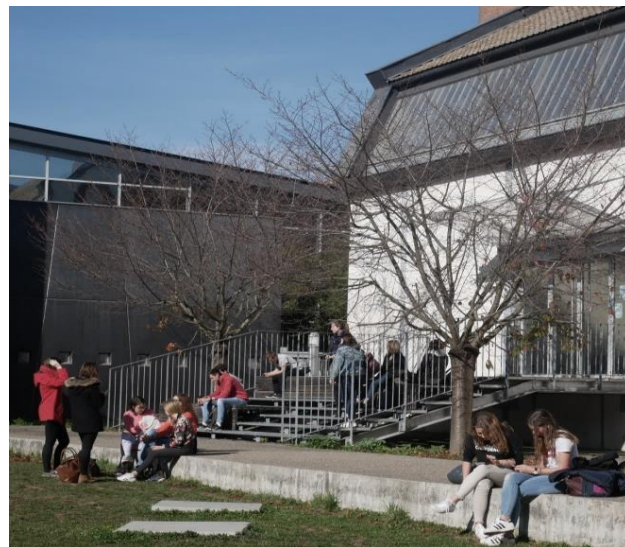
Ouverture de la salle multifonction