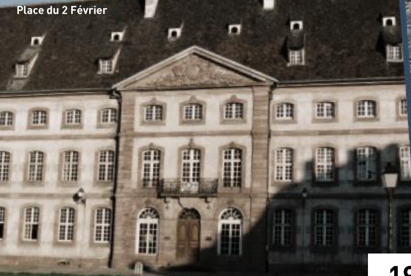
Place du 2 Février